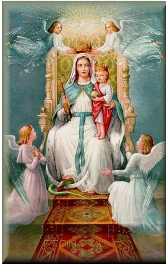
La Divina Madre